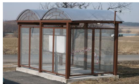
Čerpací stanice tlakové kanalizace – Vítkov. Dodávka vč. telemetrie a dálkového přenosu dat na dispečink.