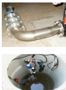
Jímka tlakové kanalizace