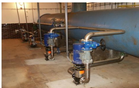
Čerpací stanice a úpravná vody: Bělá – Chuchelná Dodávka vč. telemetrie a dálkového přenosu dat.