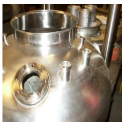
Výroba potravinářských nádrží

Realizace vodohospodářských staveb. Zpracování a práce s nerez ocelí . Konstruktérská činnost - ACAD Výroba a montáž ocelových konstrukcí.