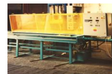
Příklady konstruktérské činnosti a výroby. Provoz firmy Singing Rock – východní Čechy. Výroba jakostních horolezeckých a pracovních lan.

Jednotlivé zakázky realizujeme formou kompletní dodávky. Poskytujeme až 5 letou záruku na dílo!