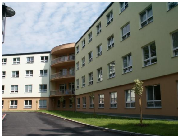
Příklad zpracování nerezových ocelí: Slezská nemocnice Opava